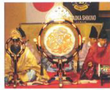
1138回 雅楽演奏を聴く