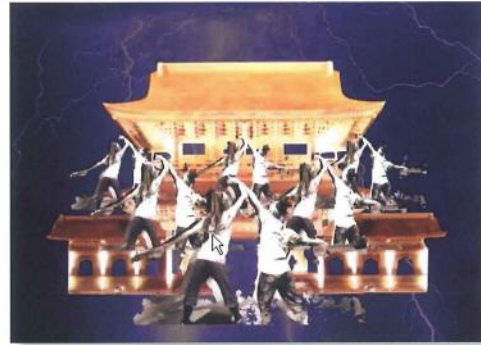
2014年(平成26年)12月12日(金曜日)