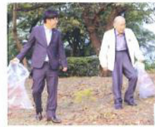
1139回ゴミ袋を手に 爽やかな早朝例会