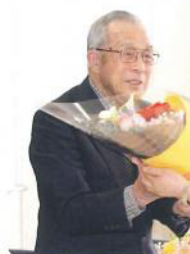
元ガバナーを囲む夕べ