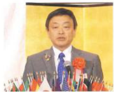
1136回地区ガバナー公式訪問