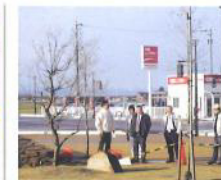
1151回早朝例会 紅梅を確認