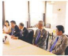
1134回 2R 役員例会訪問