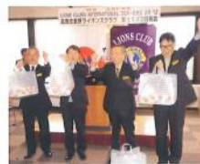
1142回結婚月のお祝い