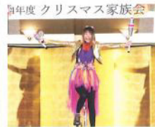
1143回ゲストパフォーマー 雫さん