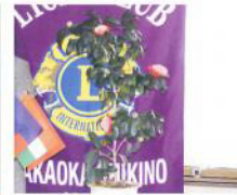
1145回 めずらしい橋の花を飾って...