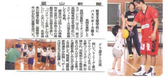
2014年(平成26年)9月3日(水曜) 富山県立高岡聴覚総合支援学校

プロバスケの技直伝 ドリブル・シュート練習 グラウジーズが高岡聴覚総合支援学校で教室 2014年(平成26年)9月3日(水曜) 高岡聴覚総合支援学校 高岡聴覚総合支援学校(以下「支援学校」)で、バスケットボールの練習を行いました。グラウジーズの選手がドリブルやシュートの技を指導し、支援学校の生徒が真剣に取り組んでいました。また、グラウジーズの選手が支援学校の生徒にバスケットボールを寄贈しました。