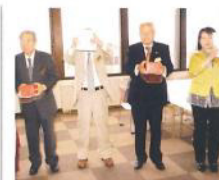
1154回誕生月のお祝い 顔を隠しているのは誰?