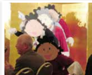
1167回 X'masサザエグザイル