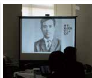
1170回 元ガバナーを囲む例会