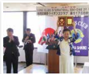
1178回 年次大会アワード披露