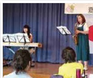
1158回 夏季家族会での演奏