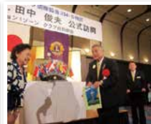
1159回 地区ガバナー公式訪問