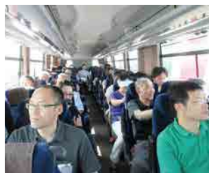
1182回 夏季家族会 バスで原発見学