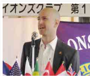
1193回 スピーチ L フォーセット