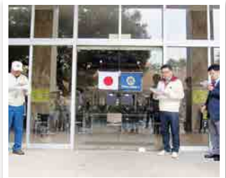
1199回 早朝例会 市民会館前で