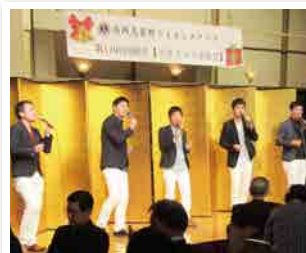
1191回クリスマス家族会 ゲスト きときとマンブラザーズ