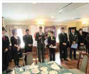
1186回 CN 記念例会 7名の入会式