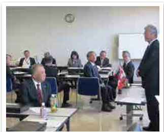
1195回 エクールにて例会