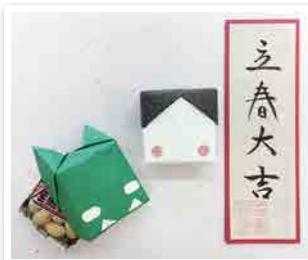
1194回 元ガバナーを称えて