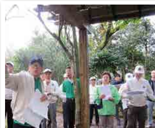
1187回 早朝例会 古城公園散策