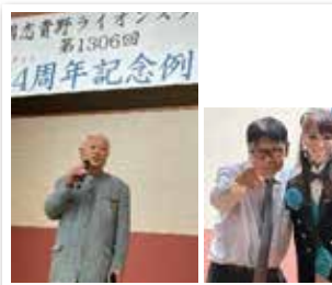
1306回 CN記念例会 となみ野 庄川荘