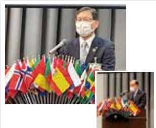
1308回 ゲストスピーチ 市教育委員会教育長 近藤 智久様