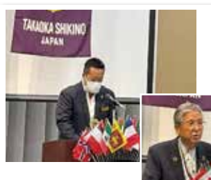
1301回 本年度予算案承認