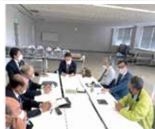
1320回 例会 次期事業委員会全体会議