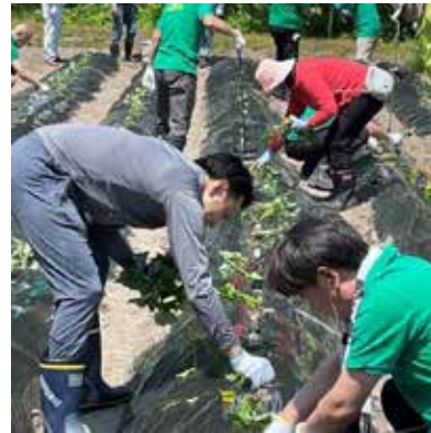
発達障がい支援活動