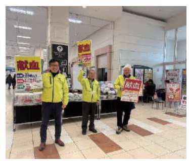
2026.3.8 第3回イオンモール高岡街頭献